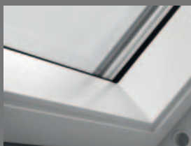
100% karbantartásmentes műanyag bevonatú fa