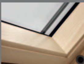
Színtelen lakkozású fa

Milyen anyagból legyen a tetőtéri ablak? Ön dönt!